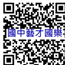
桃園市國民中學藝術才能國樂班 鑑定線上報名系統

(二)管道一(術科測驗表現優異入學)測驗成績查詢：114年4月15日(星期二)10:00起開放系統查詢，請考生自行登錄報名系統查詢術科測驗成績及下載術科測驗成績通知單。